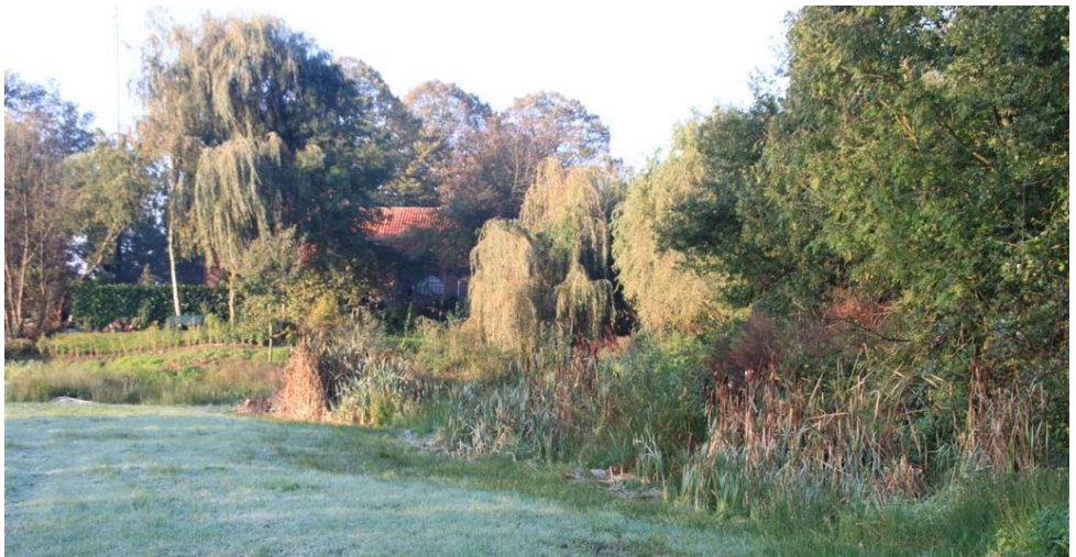
weetje Eckeltsebeek, voor de schoonmaak