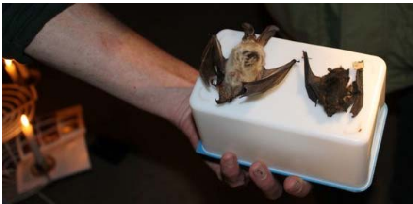
Foto: uitleg over het nachtdier de vleermuis tijdens de nacht van de nacht

Op www.floriade.nl/fotoalbum/making-of-november-2011-deel-1 kun je zien hoe het Floriadeterrein er nu bij ligt.