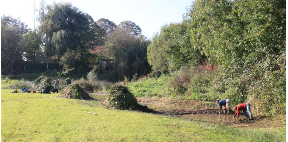
weitje Eckeltsebeek, na de schoonmaak

Ook deze klus hebben we snel ingepland en twee weken later uitgevoerd. Lichte nachtvorst maar later heerlijk in de zon gewerkt! En de klus weer geklaard! Later dit seizoen worden de wilgen rond de poel nog gezaagd.