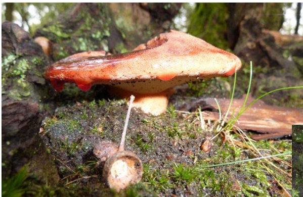
Boven- en zijaanzicht van de Biefstukzwam die in een jong stadium overvloedig "bloeddruppels" afscheidt. Een parasiet aan de voet van levende, maar verzwakte loofbomen.

Zouden we ook in staat zijn de grootste goocheltruc ter wereld onder de knie te krijgen? Wat die truc is? Een goochelaar die zichzelf laat verdwijnen!