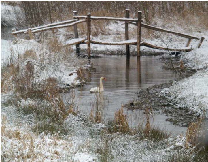
Voorkant van de programmapolder, foto van de Eckeltsebeek, Afferden (L)