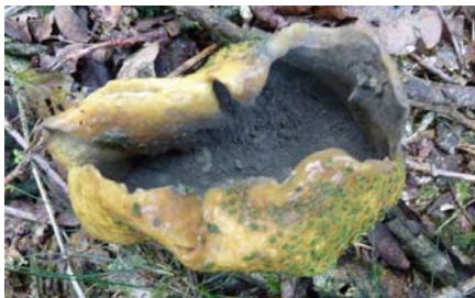
rijpe stuifzwammen, en stuiven deden ze!